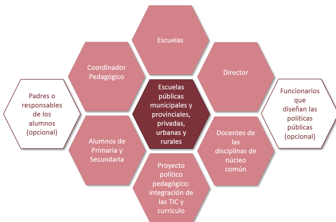
Figura 2. Unidades de análisis según el nuevo modelo conceptual

El nuevo modelo conceptual presenta un conjunto más amplio de unidades de análisis que puede tornar más completo el universo de investigación: